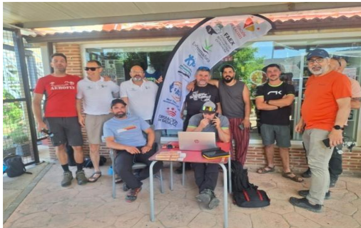
Breafing previo a la prueba

Desde el despegue de Sur (hacia el valle del Jerte) se plantearon, los dos días, una prueba por el valle de Ambroz hacía el pantano de Gabriel y Galán, con Gol en la piscina de la Granja.